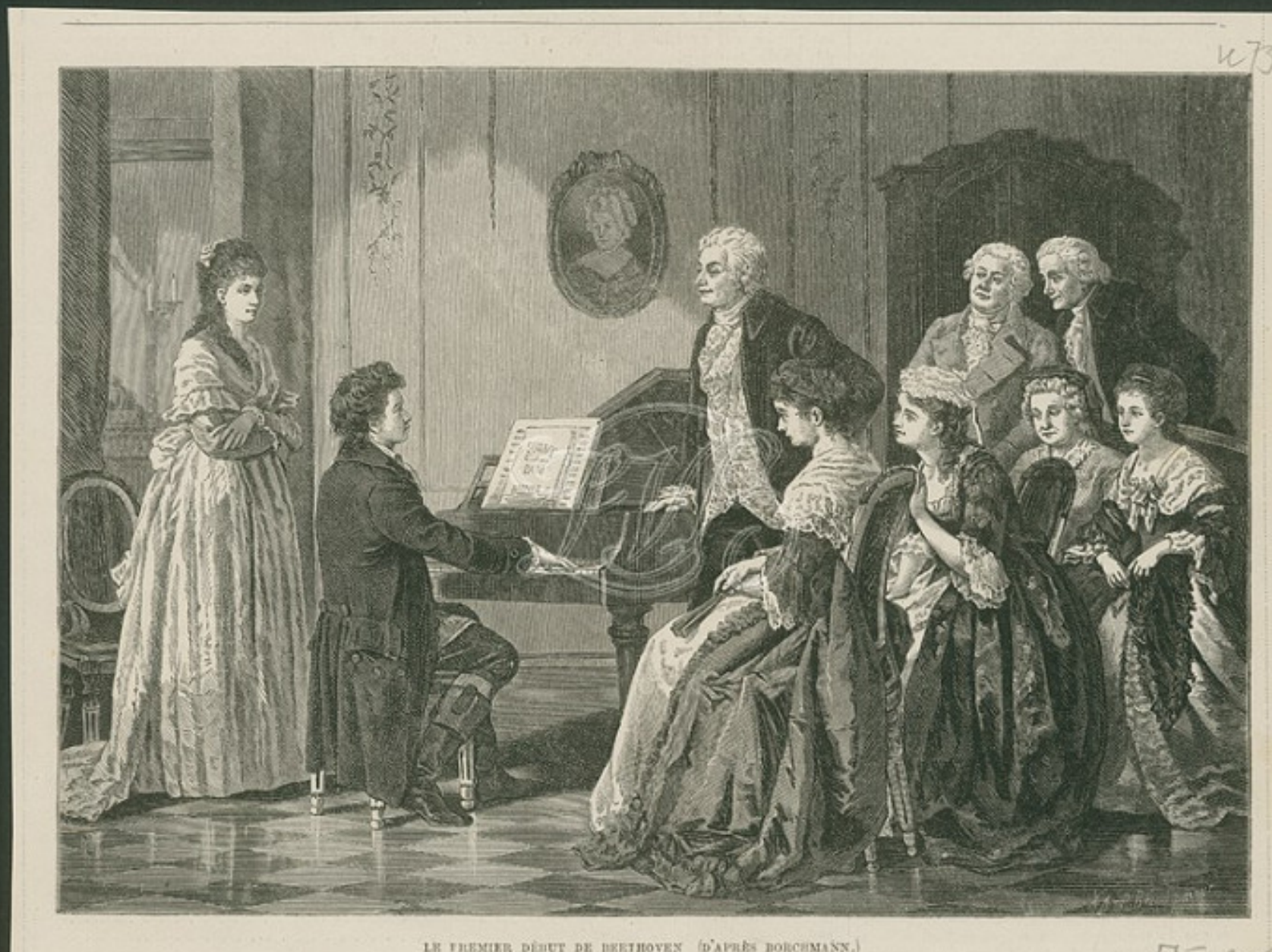
Pierwszy koncert Beethovena

Kariere pianisty rozpoczął w wieku 7 lat. Jako dziecko uczył się grać na fortepianie, organach i skrzypcach. Gdy miał 12 lat, komponował utwory, którym nadawał przedziwne tytuły na przykład: „Piosenka dla niemowlęcia” czy „Elegia dla martwego pudła”.