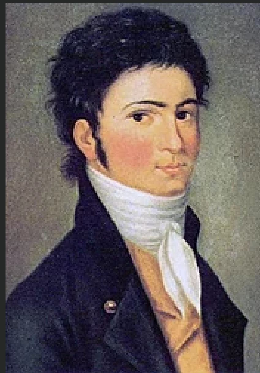
Młody Beethoven (1801)